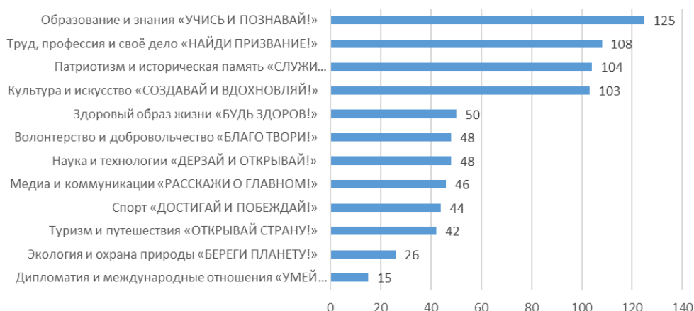
Рис. 1. Направления поддержанных заявок на предоставление субсидии в форме гранта в сфере молодежной политики в 2023 году

Около 11% поданных заявок в общем объеме были представлены детскими и детско-юношескими организациями. Такая же доля представительства данных организаций в общем объеме заявок, отобранных для субсидирования в форме гранта (рис. 2).