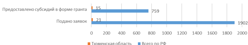
Рис. 6. Субсидирование в форме гранта организаций, реализующих молодежную политику в Тюменской области

Помимо грантодающих фондов, в системе молодежной политики активно применяется такая форма использования бюджетных средств, как субсидия в форме гранта организациям, реализующим молодежную политику. Предоставление данной субсидии носит заявительный характер. Основным распределителем бюджетных средств и организатором отбора на предоставление субсидии в форме гранта является общероссийское общественно-государственное движение детей и молодежи «Движение первых». Рассмотрим участие тюменских организаций, реализующих молодежную политику в распределении субсидий в форме гранта. Проведенный анализ результатов отбора заявок на предоставление субсидии в 2023 году показывает, что организации региона не очень активно используют эту форму грантовой поддержки, была подана 21 заявка, 15 из которых были поддержаны (рис. 6).