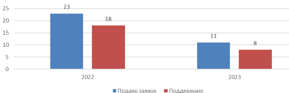
Рис. 4. Проектная активность и результативность получения грантовых средств Губернатора Тюменской области на проекты в сфере молодежной политики

За последние два года результативность проектных заявок на получение грантовой поддержки молодежных проектов за счет средств гранта Губернатора достаточно высокая и составляет не менее 70%.