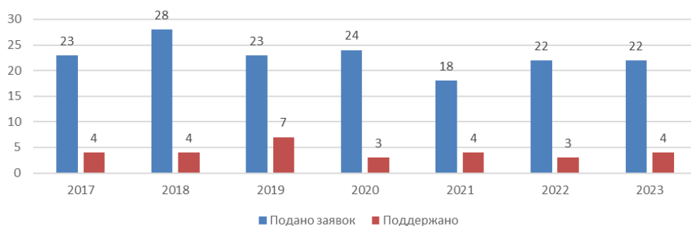
Рис. 3. Проектная активность и результативность получения грантовых средств Фонда президентских грантов на проекты в сфере молодежной политики

Проанализируем результаты участия в конкурсе на грантовую поддержку Фонда президентских грантов организаций Тюменской области. Анализ проводился только по направлению «Поддержка молодежных проектов». По данному направлению организации региона на протяжении периода 2017–2023 гг. ежегодно заявляют проекты молодежной направленности в количестве не менее 20 проектов практически ежегодно. Победу в конкурсе одерживают не все, но регион имеет ежегодный положительный результат по привлечению грантовых ресурсов данного Фонда на поддержку проектов, касающихся работы с молодежью (рис. 3,4,5).